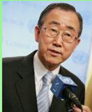
Ban Ki-Moon UN Secretary General

El Secretario General de la ONU, Ban Ki-Moon, se ha propuesto promover intensamente los Objetivos de Desarrollo del Milenio (ODM) durante su administración y, si tiene éxito, será su legado permanente para las Naciones Unidas. La mejor forma de iniciar nuestro Boletín Informativo VIVAT, en este momento, cuando se realiza la Asamblea General de Septiembre, es introducir la reflexión con las mismas palabras de nuestro Secretario General, cuya convocatoria dice: