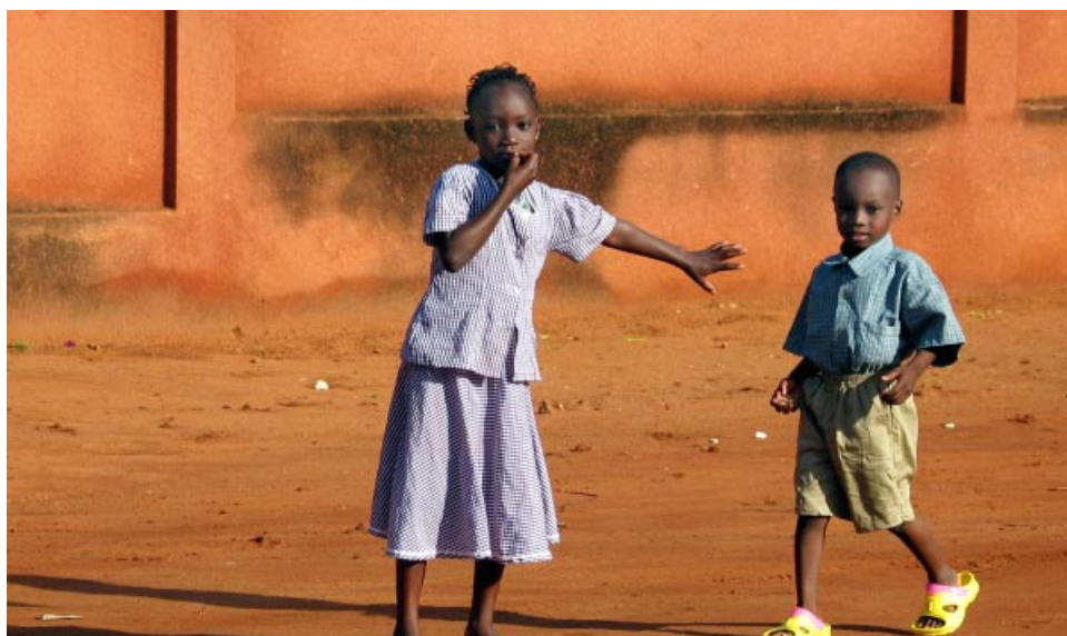
Los hermanos en Togo

para las Naciones Unidas es valiosa y su apoyo colectivo es profundamente inspirador. Con nuestros credos unidos, los servicios de oración pueden fortalecer nuestra habilidad para alcanzar las metas de vida segura de las Naciones Unidas por el bienestar de todos y del planeta.