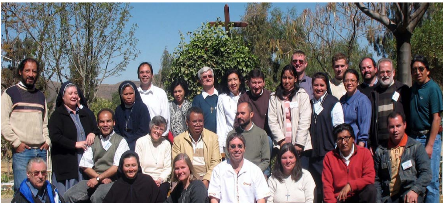
Foto: Los participantes del primer taller VIVAT International en Cochabamba, Bolivia

gregaciones fundadoras de la ONG), también están la Congregación del Espíritu Santo (CSSp) (miembro asociado), y las Congregaciones: Hermanas Misioneras del Santo Rosario (MSHR); Hermanas Combonianas (CMS); los Misioneros: Combonianos del Corazón de Jesús (MCCJ); Oblatos de María Inmaculada (OMI) y los Adoradores de la Sangre de Cristo (ASC).